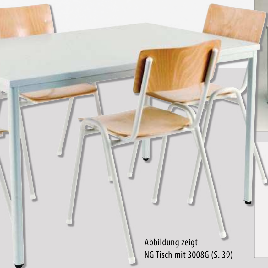
Abbildung zeigt NG Tisch mit 3008G (S. 39)