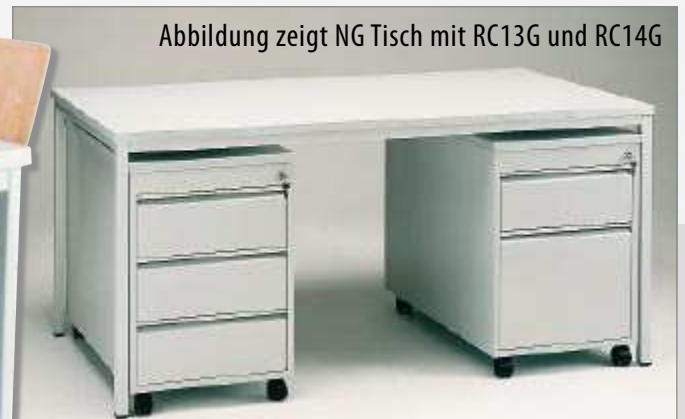
Abbildung zeigt NG Tisch mit RC13G und RC14G